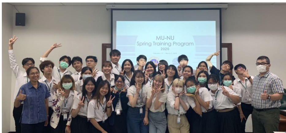
タイ・マヒドン大学:短期派遣プログラム最終発表会終了時

タイで過ごした日々は、常に新しいことや不慣れなことへの挑戦でした。その中で主に、生活面では言語や食文化の違いに、勉強面では環境に関する知識不足に悩まされました。しかし、タイの学生の積極的なサポートや日本の学生同士の協力によって乗り越えることができ、より深い理解と学習意欲の向上に繋がりました。このプログラムへの参加なく個人的にタイを訪れるだけでは、現地の専門的な知識を得て、体験や交流をすることは難しいと思います。是非この機会を逃すことなく、新しい経験や不慣れなことへの挑戦もして欲しいと感じています。