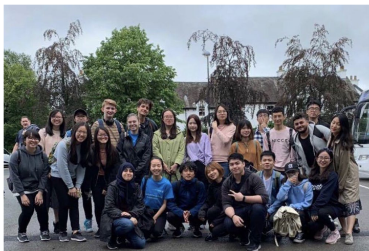
イギリス・ランカスター大学: フィールド研修

ランカスター大学への派遣では、毎日異なる環境に関する分野を実際にフィールドに出ることで身をもって問題点を経験し、学ぶことができました。環境問題を解決するためには視野を広く持ち、技術的なことと社会的なことを関連付けて考えていくことの大切さを学びました。また、ランカスター大学のプログラムには多くの国から学生が参加していたため、様々な国の学生と交流することができ、住む地域が異なれば考え方も異なるため、様々な視点から物事を考える力を得ることができたと思います。学校生活以外では、イギリスの美しい街並みや自然を体験でき、とても良い経験となりました。