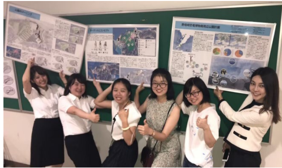
長崎まちづくりワークショップの最終発表会終了時

第1回目から参加していた私にとって、このワークショップがランドスケープ分野の学び、さらには英語力を深めたいという意欲に大きく寄与していただけでなく、毎年参加していたことで、1年間の自分の成長を確かめる場になっていたのは間違いありません。特に5回目の今回は自らの英語の拙さを理由に議論を諦めることなく、留学生と共に議論しながら活動でき、嬉しく思いました。今後、専門性を高めるにあたって彼らのアイデアの豊富さ、技術力の高さは、やはり目標となるものでしたし、将来、また共に活動できたら、素敵だなと感じています。