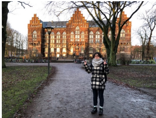
スウェーデン・ルンド大学: 大学図書館前

ルンド大学への留学を通して、私は環境分野の研究を行っている教授や先輩方と交流する機会を持つことで自分の研究に対するモチベーションを高めることができました。2ヶ月半の研修期間中には自分の卒業研究をプレゼンテーションすることがあり、自分が大学4年間で学んだ成果を外部で披露することはとても勉強しがいのあることだと感じられました。英語によるコミュニケーションはうまくいかないことばかりでしたが、自分なりに工夫したり友人や教授らに支えられたりして乗り越えました。これらの経験は私にとって大きな自信となったので、留学に挑戦して良かったと思っています。