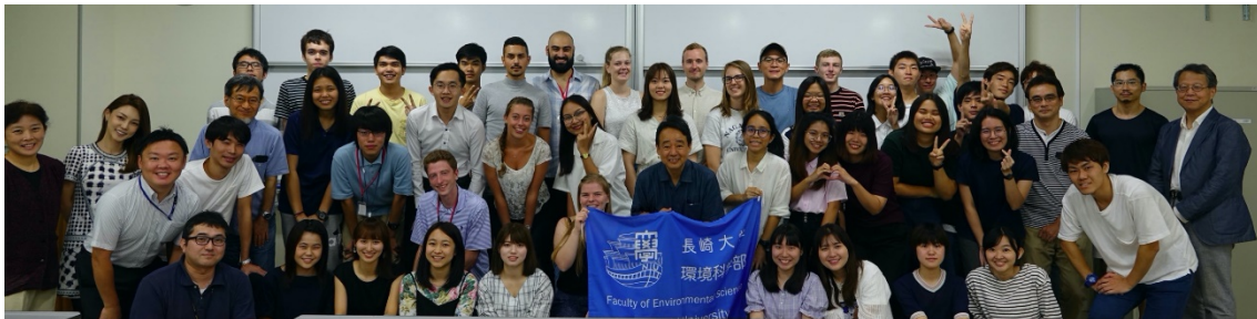
環境サマースクール修了式

サマースクールに参加して、長崎県内ですが今までに経験したことのないたくさんのことを経験することができました。一つ目は海外の友人ができたことです。サマースクールでは様々な国の学生が参加するため、それぞれの文化を持つ友人と話し共有することができました。二つ目は、長崎県内の観光地や施設に行ったことです。どの場所でも、海外の友人は日本語が通じないので、日本の学生は日本語を英語に訳し説明します。英語が得意ではない私ですが、日本、そして長崎の魅力を友人に伝えたい気持ちが強くなり、できるだけ英語を使おうと必死に励むことができました。