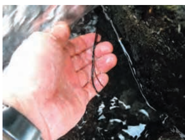
絶滅危惧種淡水紅藻オキチモズク

(2) の絶滅危惧種淡水紅藻オキチモズクは、環境省レッドデータリスト絶滅危惧Ⅰ類に挙げられている希少藻類で、愛媛県、福岡県、長崎県、熊本県、鹿児島県、沖縄県のごく限られた小河川にしか生育していません。そのオキチモズク藻体を室内培養で直立体まで育て上げる試みを続けています。