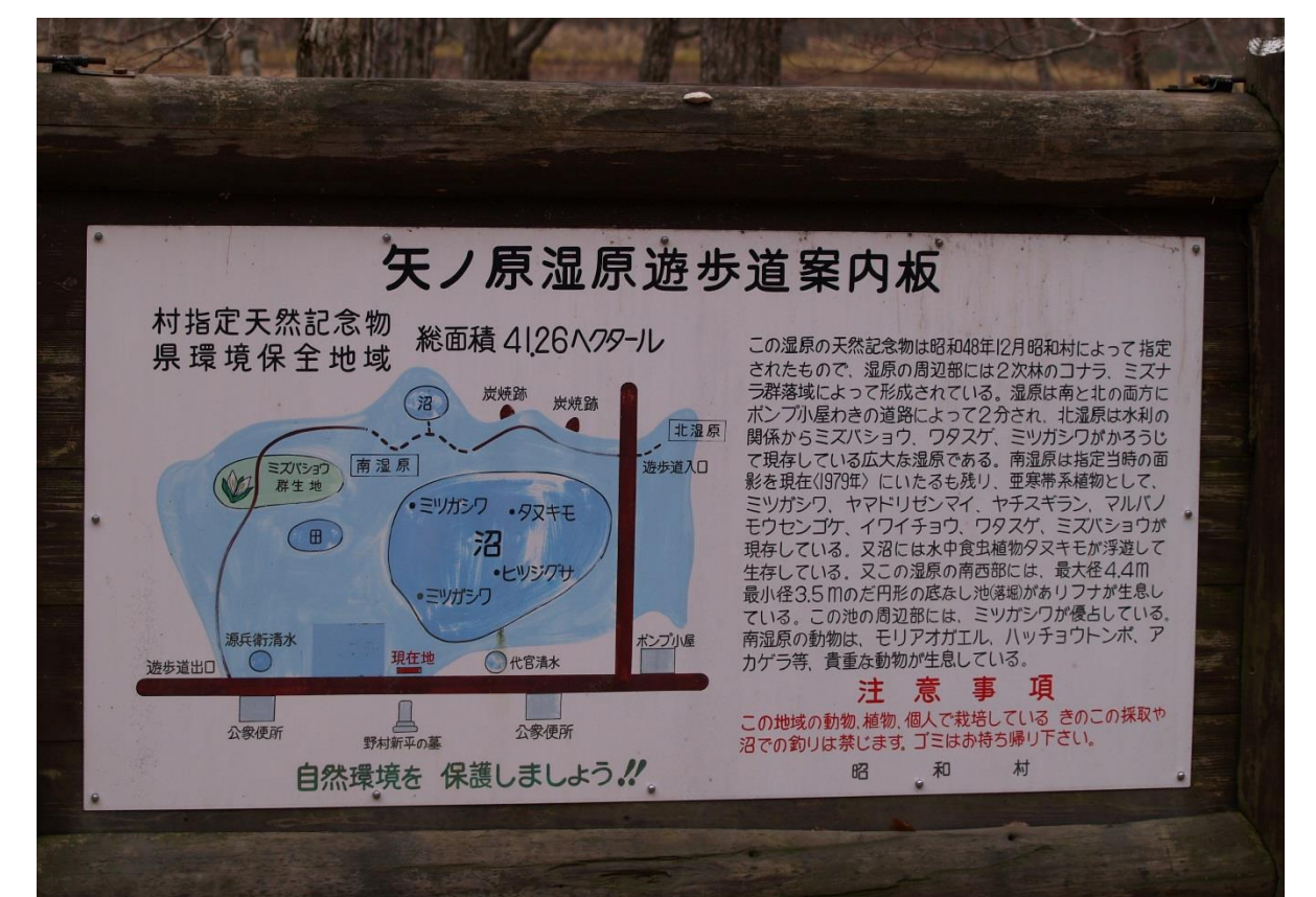
写真B 標識・看板の調査