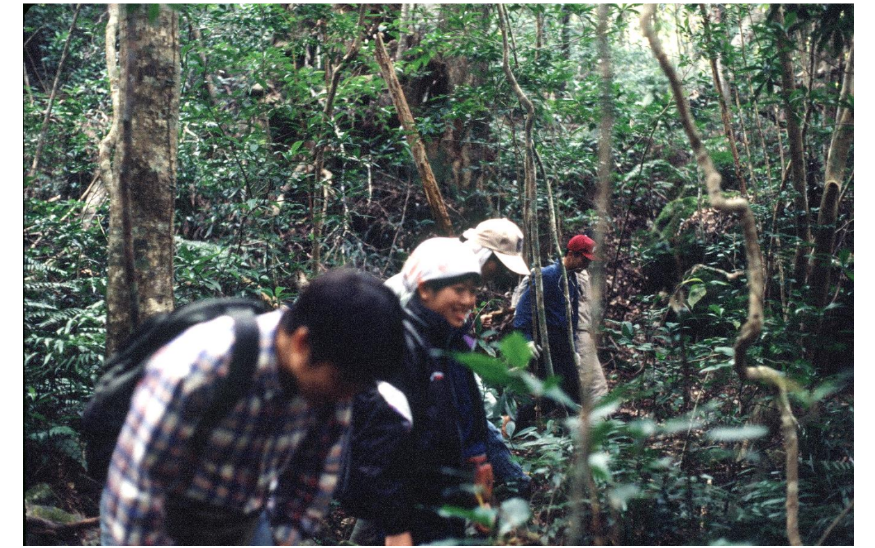
写真A 野生動物の調査