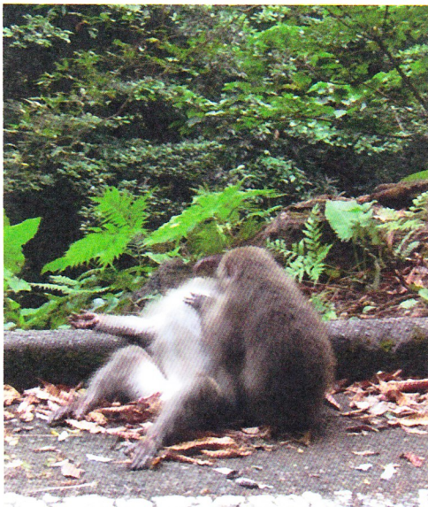
西部林道で遭遇したヤクザル

なす緑色と東シナ海の青色のコントラストが魅力的である。しかし、ここでも生態系保全を考えると避けては通れない課題が存在する。ウミガメは、NPO 法人屋久島うみがめ館をはじめとする地域の方々の献身的な努力により、日本随一の産卵地としての環境が保たれている。ただ、ライトの点灯やフラッシュによる写真撮影を故意でなくともおこなってしまうことで、警戒心の強いウミガメは上陸を避けるという結果を招きかねないという。西部林道地域は、とくにヤクジカの増加が、私が前回屋久島を訪れた8年前よりもかなり目についた。屋久島では生態系のピラミッドのなかでおそらく頂点に位置するのはシカだと考えられている。かつては人間が動物の命をいただくことで、屋久島での生態系も繊細なバランスのもとに成立していたものが、保護の行き過ぎは却って人間と共生していた生態系に負の影響を与えかねない。ヤクザルの食害も深刻と聞くが、何しろ今回の滞在ではシカの多さが気になった。