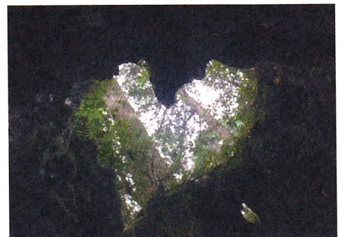
ハート型が人気のウィルソン株