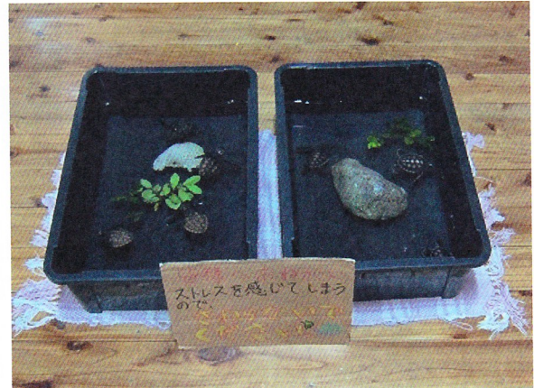
ウミガメの産卵場所に保護柵が設置されている永田浜と、屋久島うみがめ館で飼育されている子ガメ