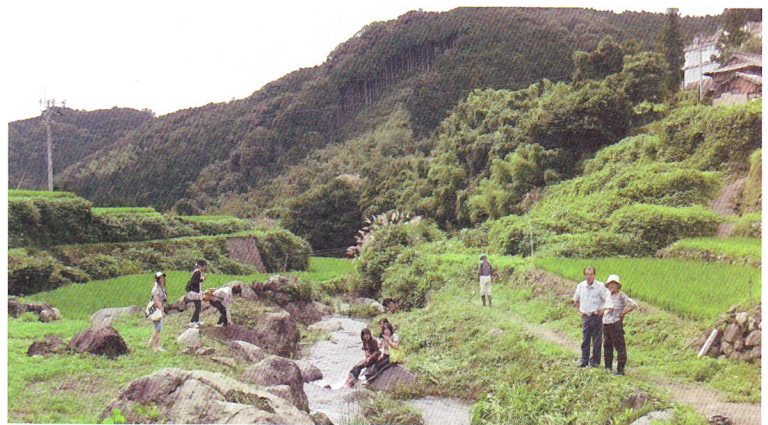
金浜川での生き物調査。右上の白い建物が小田山分校

毎回、私たちが快く受け入れてくださる、雲仙市小浜町小田山地区のみなさんに、この場を借りてお礼申し上げます。次回も、多くの学生の参加を引き続きお待ちしております。