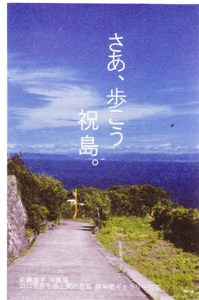
祝島で配られている絵はがき

波が穏やかな瀬戸内海に、静かに浮かぶ島がある。名を祝島と言ひ、全国各地から釣りの愛好家が集まる、人口およそ500人の自然豊かな島だ。島民のほとんどが第一次産業で生計を立て、山と海の恵みと共に生きている。その目と鼻の先で、原子力発電所の建設計画が進んできた。島民は自分たちの子孫と、その子たちが暮らす環境を守るため