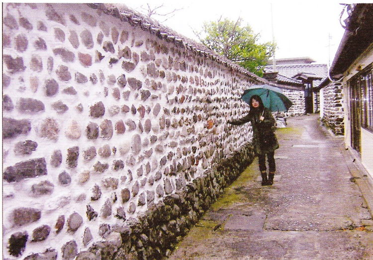
祝島にみられる独特の練り堀

30年以上も抗議行動を続けている。これに関するドキュメンタリー映画『ミツバチの羽音と地球の回転』『祝の島』が、現在公開中である。今年の夏から本格的な工事が行われる様子だったが、原発事故を受け計画が中断された。今後工事がどうなるかは分からないが、島の人々は『自然エネルギー100%プロジェクト』を開始するという。彼らはエネルギーを、食糧生産や人間の力すべてを含んだものと捉えている。「島の生活、そのすべてがエネルギー」なのである。彼らの考え方は、今後のエネルギー政策の鍵となってくるのではないだろうか。エコな