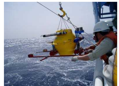
海底地震仪的投放现场

使用水产系的练习船“长崎丸”号，在每年 4~7 月期间对九州周边海域进行海底地震观测。此外，还通过国家地震数据流通系统实时收集日本各地的地震波形数据，主要分析其中九州各地的地震活动情况。